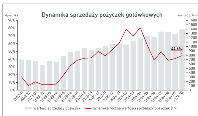
Wartość i dynamika roczna (miesiąc do miesiąca roku poprzedniego)

W segmencie tym można wyróżnić dwie kategorie pożyczek gotówkowych. Pożyczki gotówkowe udzielane na niskie kwoty i krótkie okresy – tzw. „chwilkówki” oraz na wysokie kwoty i długie, często kilkuletnie okresy. Ten drugi typ pożyczek podobny jest do